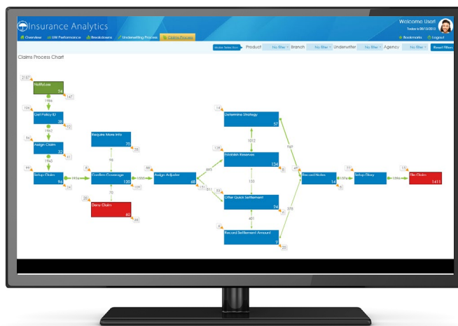
Visibilità completa end-to-end sui processi

In poche parole, Insight fornisce il contesto indispensabile per rispondere alle domande a cui gli altri strumenti di BI non possono rispondere. Attraverso l'uso congiunto di Process Intelligence e BI, ora gli utenti sono in grado di analizzare i